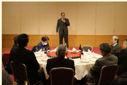
(オープニング社長挨拶)