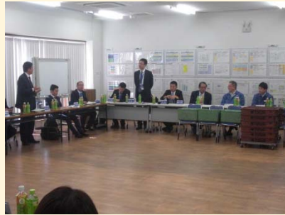
(参加者全員でディスカッション)