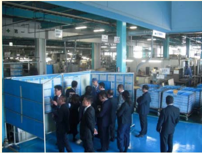
(現場の活動状況説明)