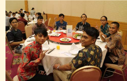
〔実習生も正装で参加〕