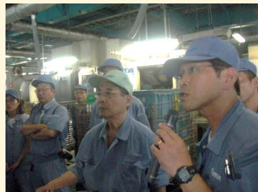
〔切削加工G活動報告〕