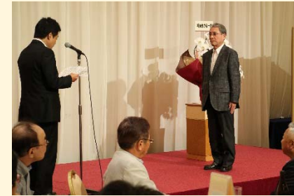
〔野嶋専務からお礼の言葉〕