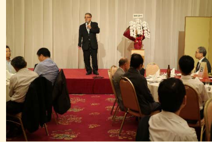
〔野嶋社長開会挨拶〕